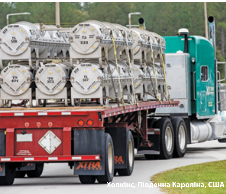
Хопкінс, Південна Кароліна, США